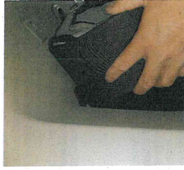
Abb.4 Klettverbindung festdrücken