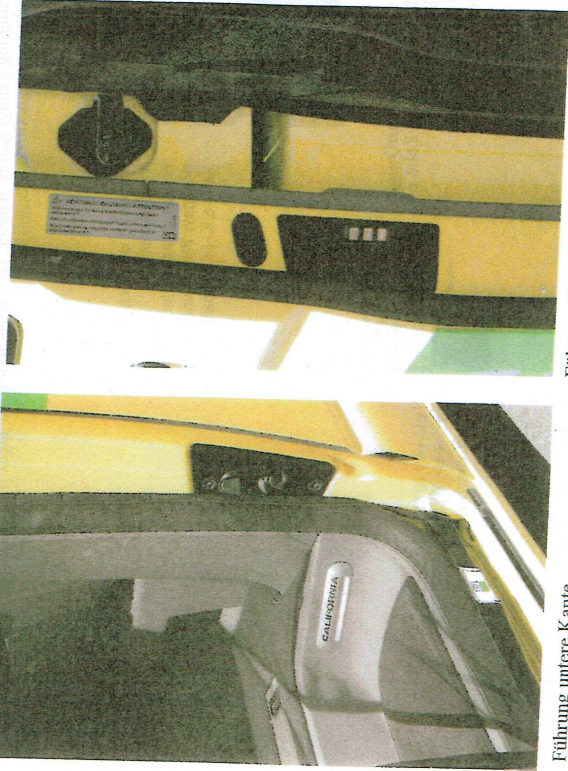
Führung untere Kante