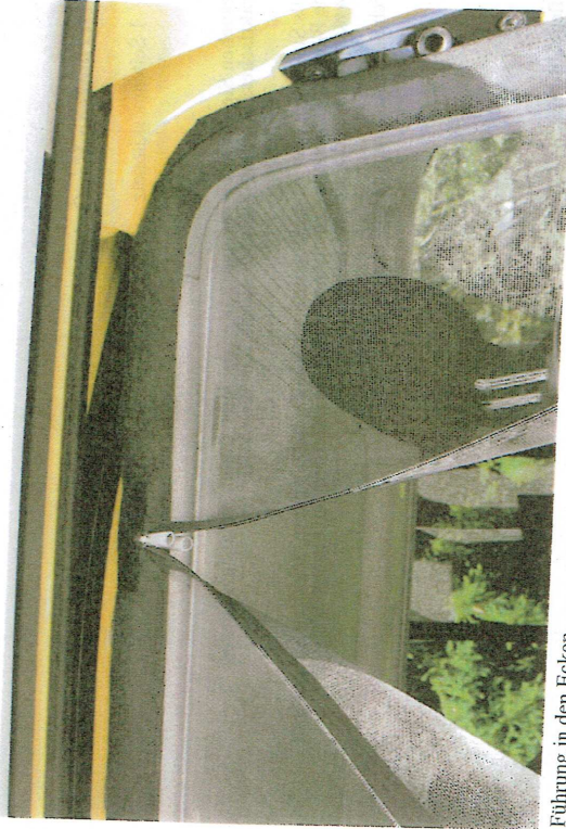
Führung in den Ecken